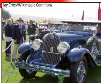
Jay Cross/Wikimedia Commons

Les concours d'élégance automobiles font partie du paysage des passionnés de véhicules d'époque. Pour autant, ils se font rares en France et il est donc important de les valoriser. Parce que le concours d'élégance du Gazoline Festival se doit d'être l'un des points d'orgue de ce week-end de festivités, nous avons souhaité qu'il soit labellisé FFVE, gage de sérieux et de qualité s'il en est. Organisé le samedi en fin d'après-midi, il regroupera les plus belles autos du Festival réparties en quatre catégories, un Trophée FFVE étant décerné pour chacune d'entre elles. Le plus beau véhicule tous classements confondus recevra quant à lui le Trophée Or pour le Grand Prix d'excellence. Les différentes catégories ainsi que les modalités d'inscription préalable (obligatoire) seront précisées dans notre numéro d'avril.